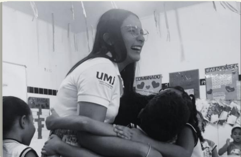
Foto 1: Aluna do curso de fisioterapia desenvolvendo atividades de extensão no período de 2023.1.