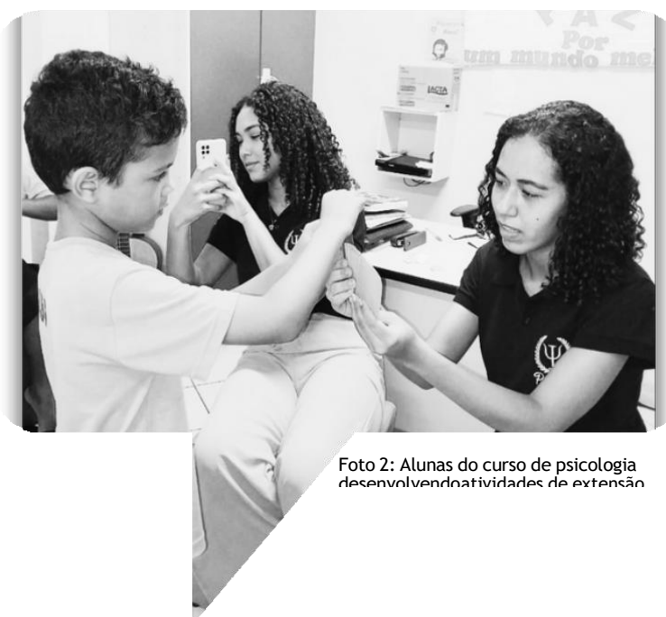
Foto 2: Alunas do curso de psicologia desenvolvendo atividades de extensão